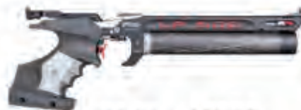
Walther LP500 Meister Manufaktur