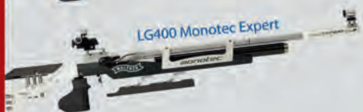
LG400 Monotec Expert