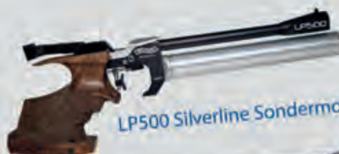
LP500 Silverline Sondermodell