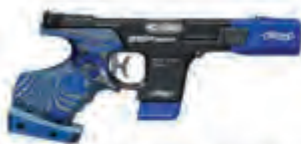
Walther Sportpistole GSP500 .22lr