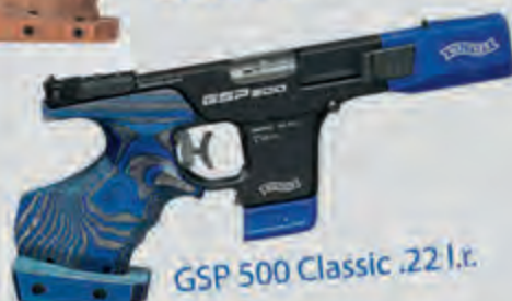
GSP 500 Classic .22 l.r.

Alle aktuellen Preise und vollständige Beschreibungen zu den Produkten finden Sie online unter: