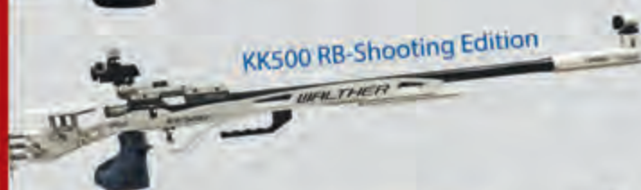
KK500 RB-Shooting Edition