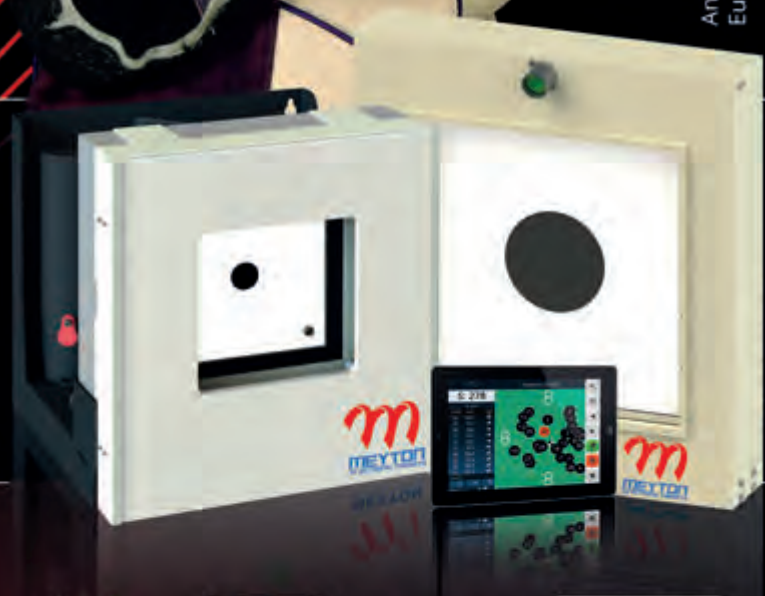
Darstellung nicht maßstabsgerecht

MEYTON ANLAGEN STEHEN FÜR HOCHWERTIGE, IN DER INDUSTRIE UND IM PROFISPORT BEWÄHRTE , 100% BERÜHRUNGSLOSE INFRAROT-MESSTECHNIK. UNSCHLAGBAR IN ALLEN DISZIPLINEN VON 10M BIS 100M.