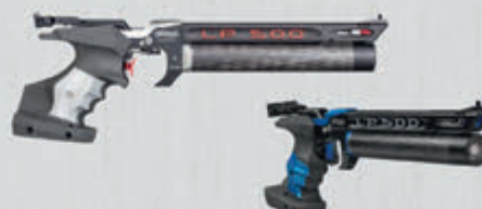
LP 500 Meistermanufaktur Elektronischer Abzug