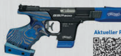
GSP 500 Classic .22 L.r.