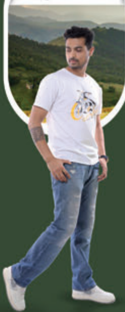
SWAPNIL KUSALE OLYMPIC BRONZE MEDALIST