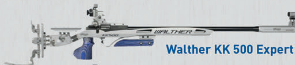
Walther KK 500 Expert Freihand