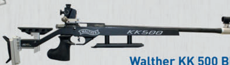
Walther KK 500 Blacktec Freihand