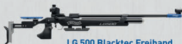
LG 500 Blacktec Freihand