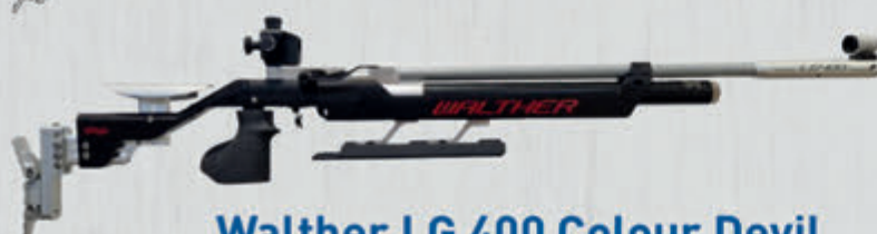
Walther LG 400 Colour Devil