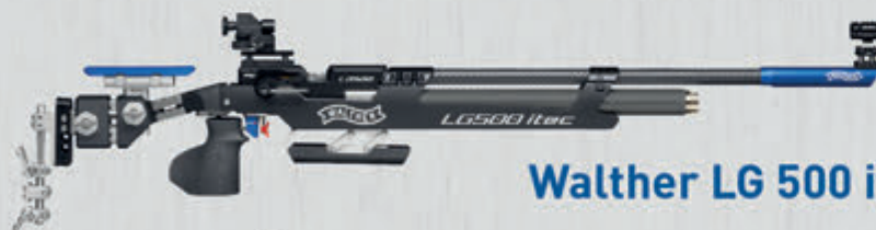
Walther LG 500 itec E