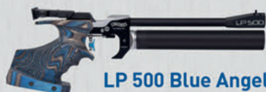
LP 500 Blue Angel