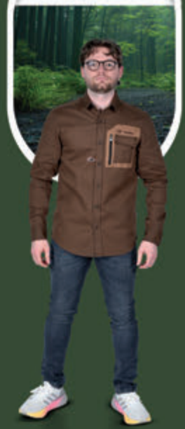
MAXIMILIAN ULBRICH OLYMPIAN

Von Wettkampfstätten bis zu Bergpfaden definiert Capapie Leistung durch Komfort und Innovation.