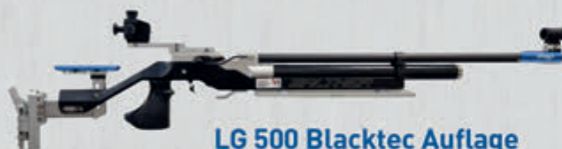
LG 500 Blacktec Auflage