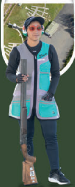
NEERU INTERNATIONAL MEDALIST